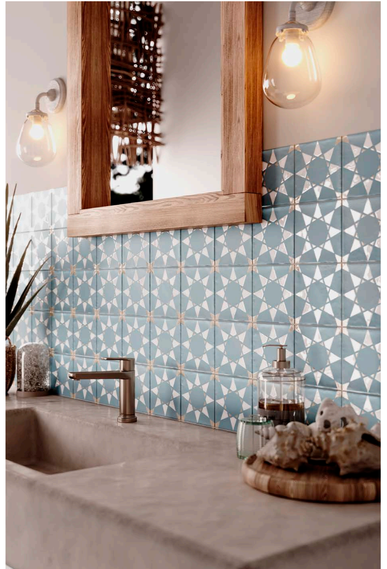
Fez Noor Blue-White-C 12x12 cm - 4.7" x 4.7"