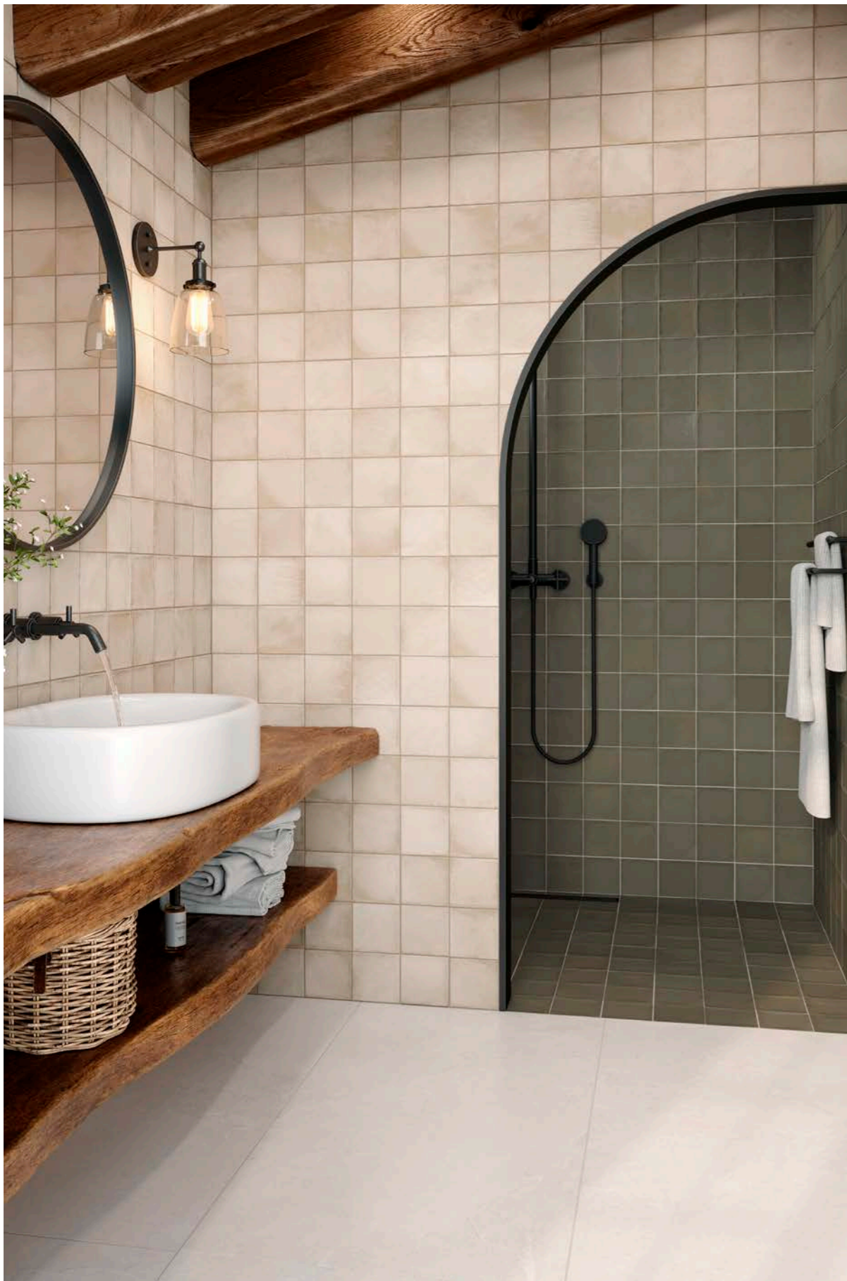
Fez Cream 12x12 cm - 4.7" x 4.7" / Fez Sage 12x12 cm - 4.7" x 4.7"