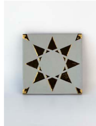
Noor Lumier-Gold 12 x 12 cm - 4.7" x 4.7"