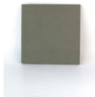
Sage 12 x 12 cm - 4.7" x 4.7" 1,3 x 12 cm - 0.6" x 4.7"