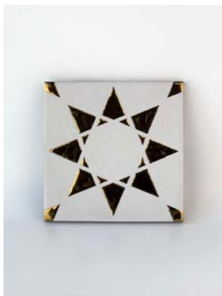
Noor White-Gold 12 x 12 cm - 4.7" x 4.7"