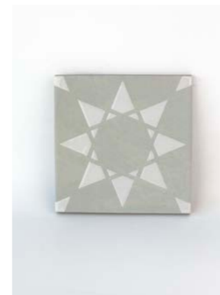
Noor Pearl-White 12 x 12 cm - 4.7" x 4.7"