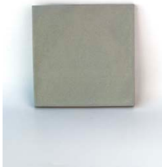
Pearl 12 x 12 cm - 4.7" x 4.7" 1,3 x 12 cm - 0.6" x 4.7"