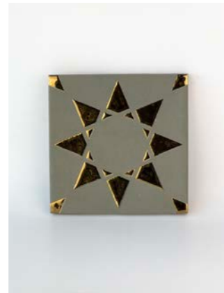
Noor Sage-Gold 12 x 12 cm - 4.7" x 4.7"