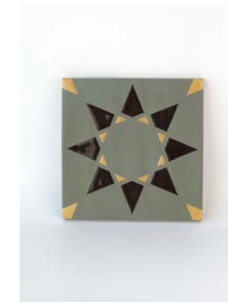
Noor Sage-Black-M 12 x 12 cm - 4.7" x 4.7"