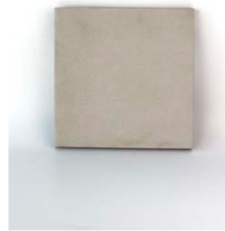
Cream 12 x 12 cm - 4.7" x 4.7" 1,3 x 12 cm - 0.6" x 4.7"