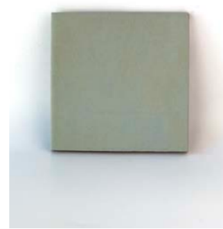
Lumier 12 x 12 cm - 4.7" x 4.7" 1,3 x 12 cm - 0.6" x 4.7"