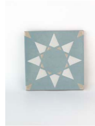
Noor Blue-White-C 12 x 12 cm - 4.7" x 4.7"