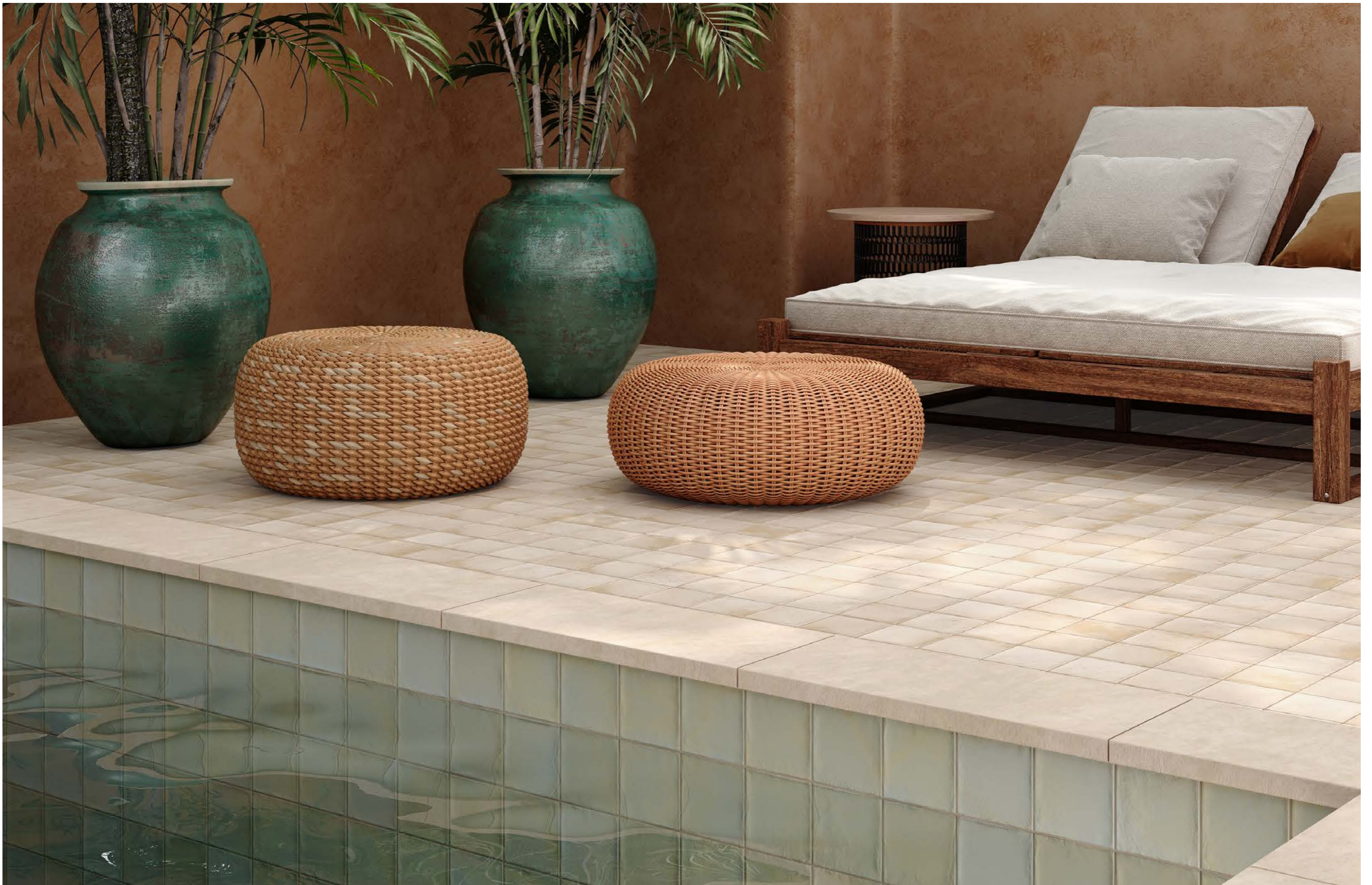
Fez Cream 12x12 cm - 4.7" x 4.7" / Fez Lumiere 12x12 cm - 4.7" x 4.7"