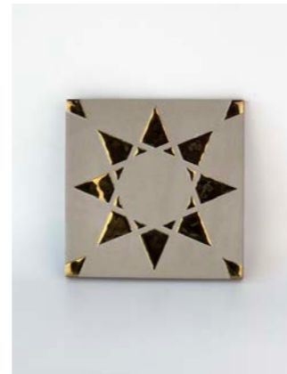
Noor Taupe-Gold 12 x 12 cm - 4.7" x 4.7"