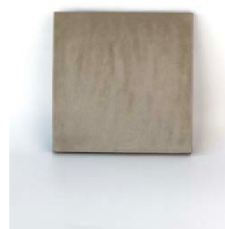
Taupe 12 x 12 cm - 4.7" x 4.7" 1,3 x 12 cm - 0.6" x 4.7"