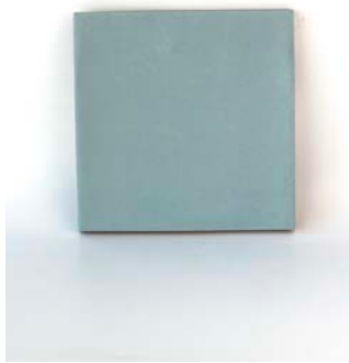
Blue 12 x 12 cm - 4.7" x 4.7" 1,3 x 12 cm - 0.6" x 4.7"