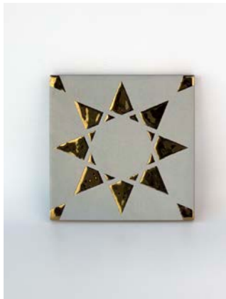
Noor Pearl-Gold 12 x 12 cm - 4.7" x 4.7"