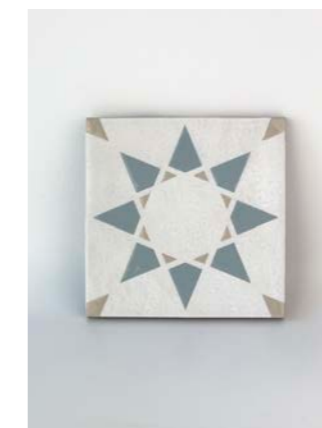
Noor White-Blue-C 12 x 12 cm - 4.7" x 4.7"