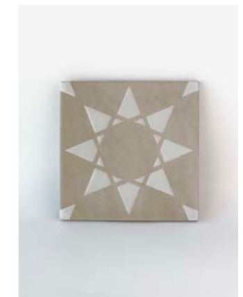
Noor Taupe-White 12 x 12 cm - 4.7" x 4.7"