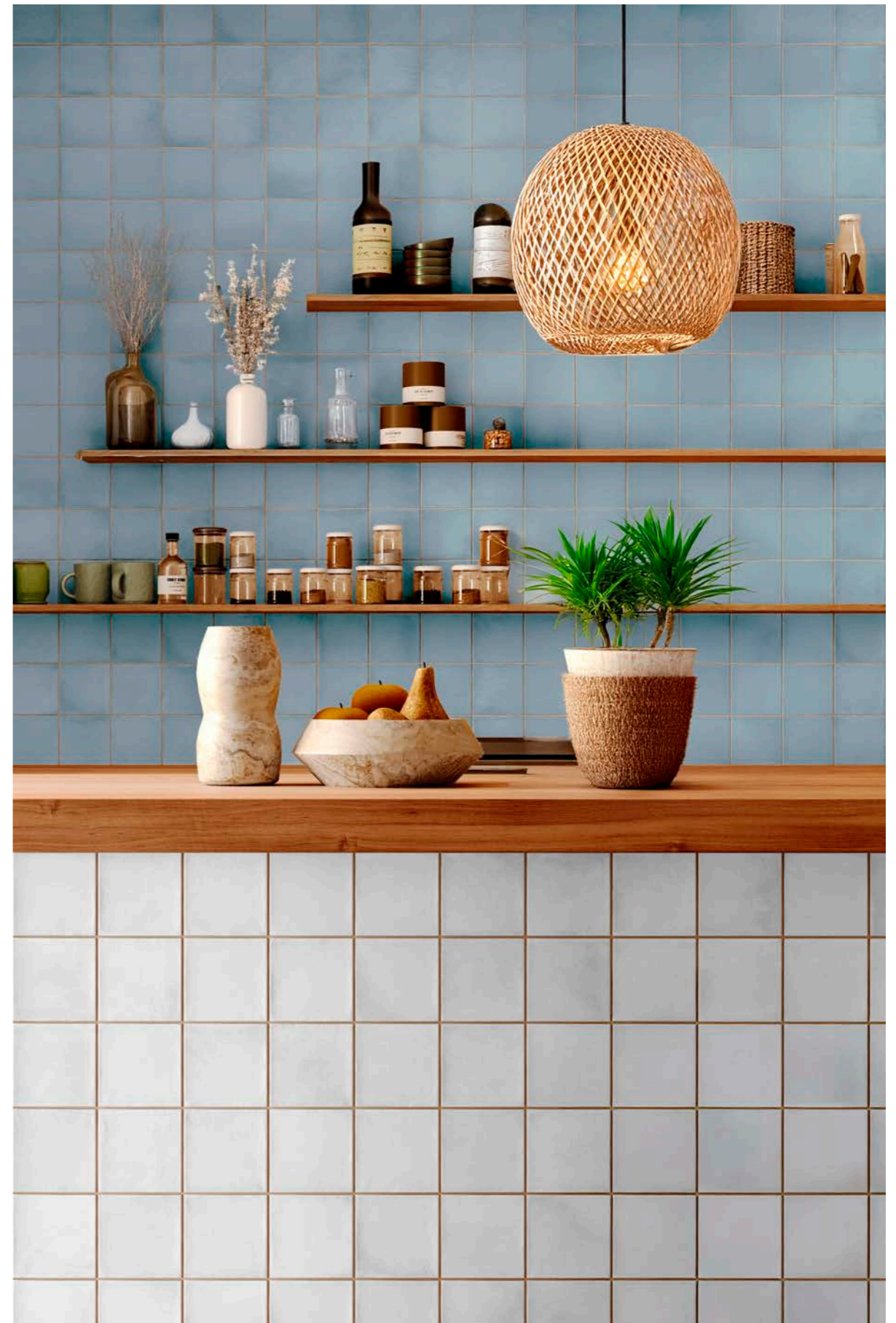
Fez Blue 12x12 cm - 4.7" x 4.7" / Fez White 12x12 cm - 4.7" x 4.7"