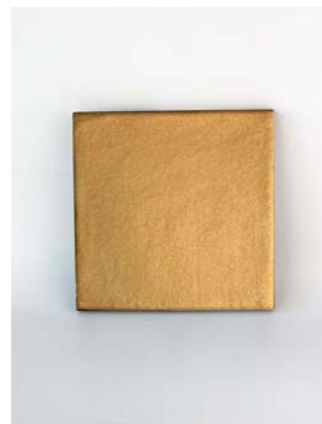
Gold M 12 x 12 cm - 4.7" x 4.7"