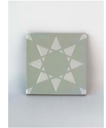
Noor Lumier-White 12 x 12 cm - 4.7" x 4.7"