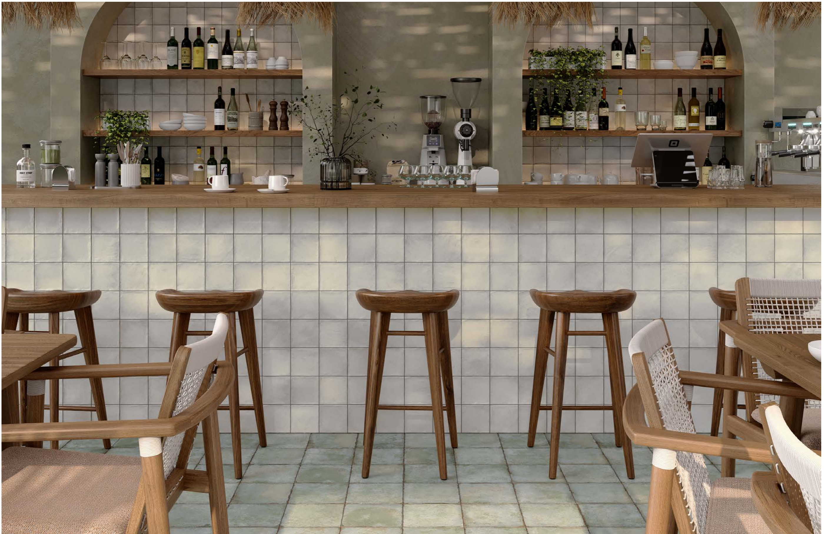
Fez Pearl 12x12 cm - 4.7" x 4.7"