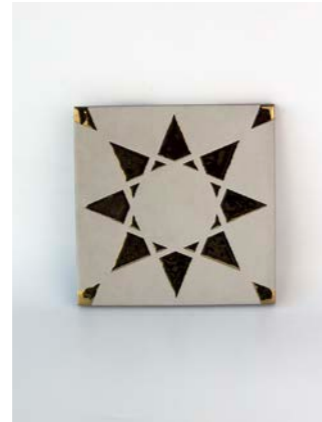
Noor Cream-Gold 12 x 12 cm - 4.7" x 4.7"