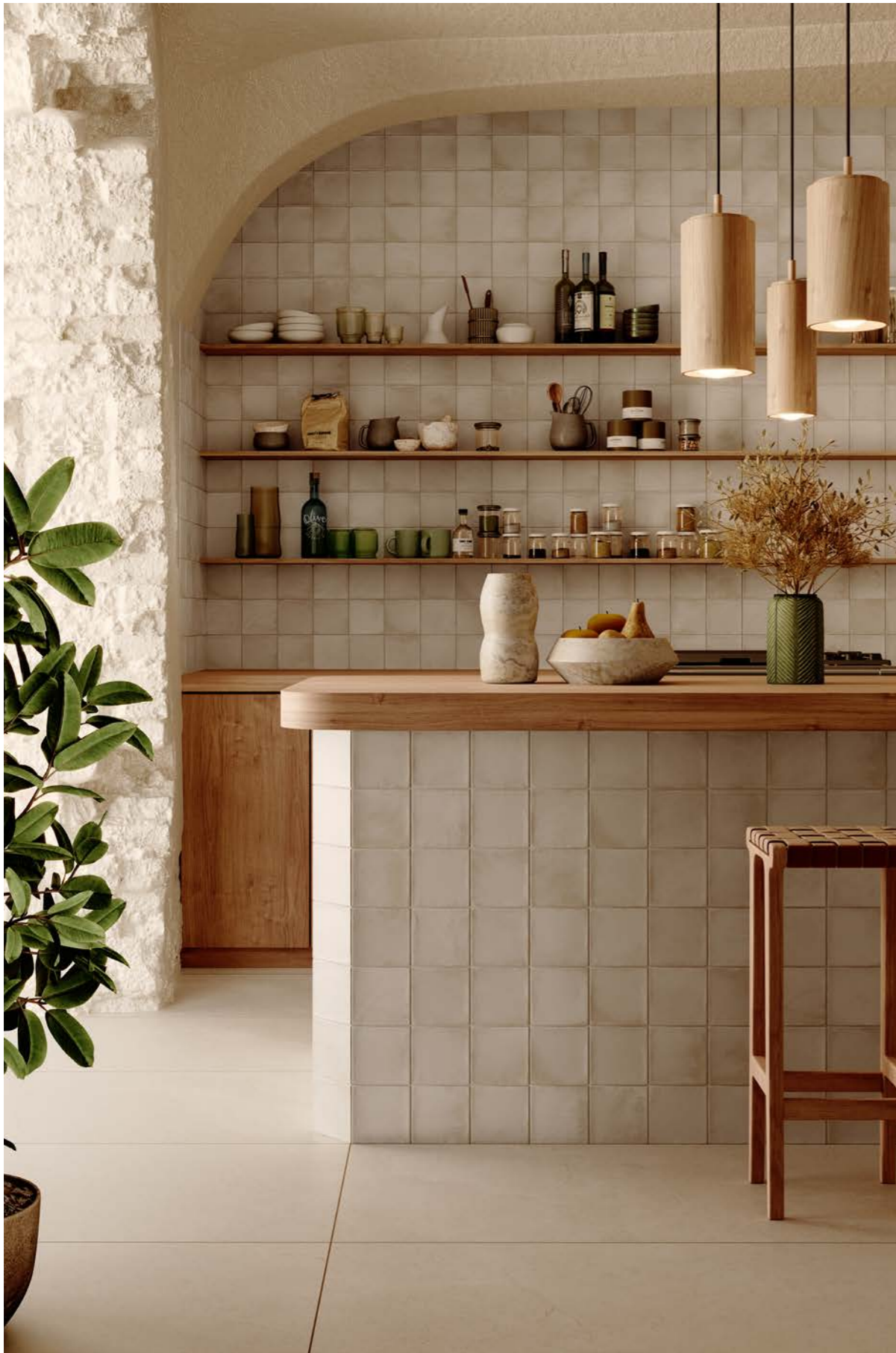
Fez Taupe 12x12 cm - 4.7" x 4.7"