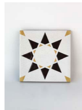
Noor White-Black-M 12 x 12 cm - 4.7" x 4.7"