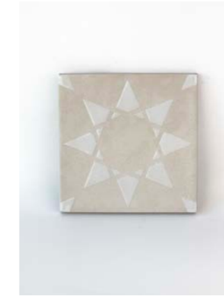
Noor Cream-White 12 x 12 cm - 4.7" x 4.7"