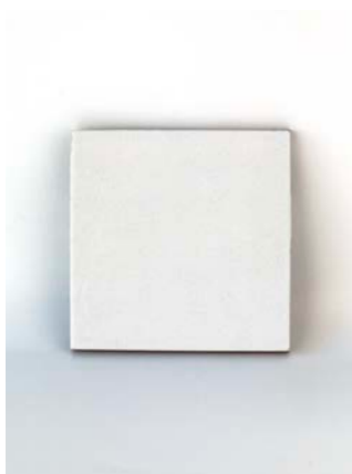
White 12 x 12 cm - 4.7" x 4.7" 1,3 x 12 cm - 0.6" x 4.7"