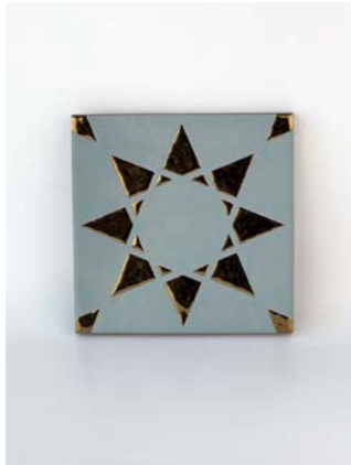
Noor Blue-Gold 12 x 12 cm - 4.7" x 4.7"